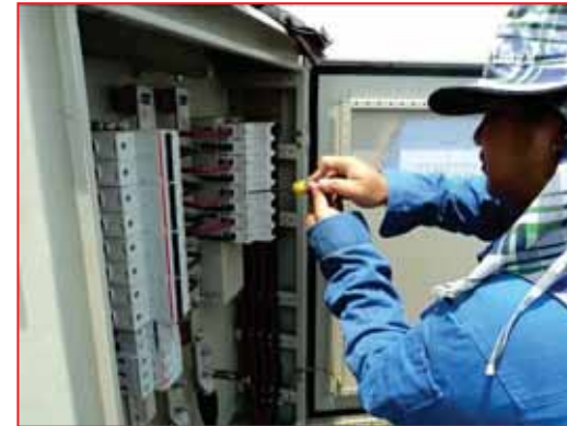
Tighten the NUT