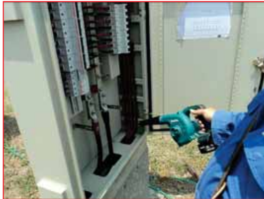
Cleanning the dust