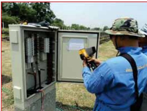
Hot spot Temperature